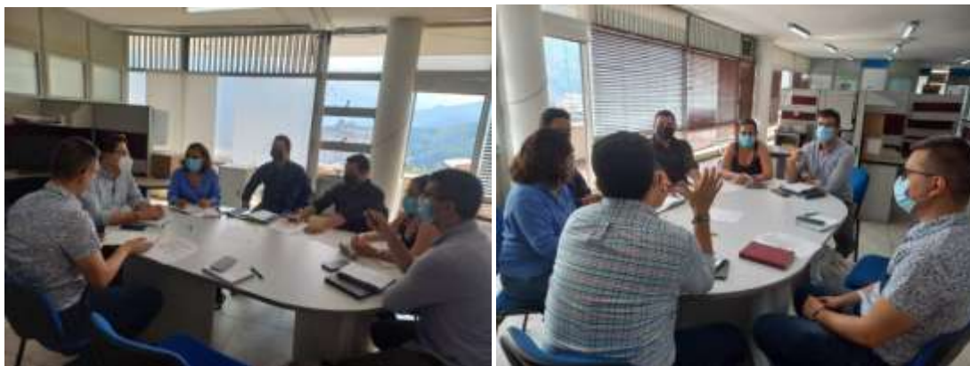
Fotos: 03-02-202; Comité con secretaria de inclusión social; Ibagué-Tolima