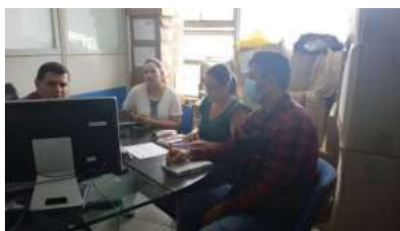
(Fotos: 25-04-2022 y 18-05-2022; Reunión SDE y SIS Ibagué-Tolima)